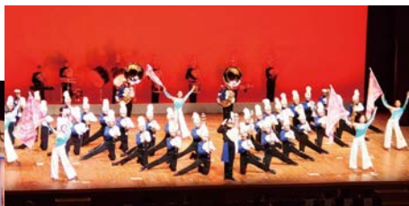
▲精華女子高等学校吹奏楽部のステージマーチング