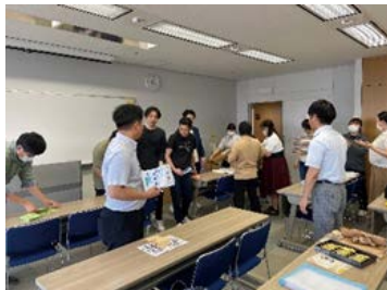
▼就職フェア準備の様子