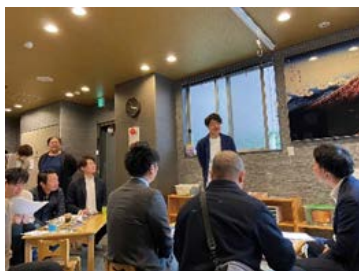
▲他都市視察研修の様子

さて、冒頭で述べた通り、青年部は今年度創立38年を迎えました。2年後の令和7年度には創立40周年の記念すべき節目を迎えることとなり、同年には記念式典の実施も予定されています。多くの先輩方が紡いできてくださった青年部の歴史を、次代の保育者である後輩たちにもつないでいけるような式典にしたいと考えています。 最後になりますが、今後とも青年部活動に関しまして、これまで以上のご指導・ご鞭撻を賜りますようお願い申し上げます。 ※青年部では、これからの保育を語る仲間を募集しています。45歳以下の次世代の園運営を担う先生、是非とも入会お待ちしております！ご希望される方は保育協会事務局までご連絡ください。 （機関紙編集委員 高山拓人）