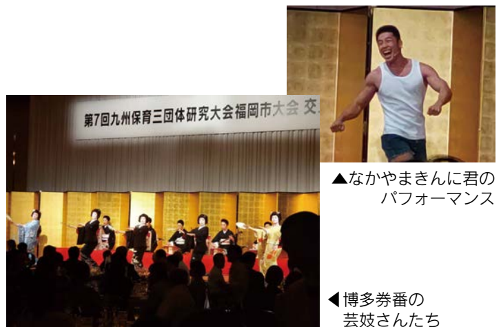
▲なかやまきんに君のパフォーマンス