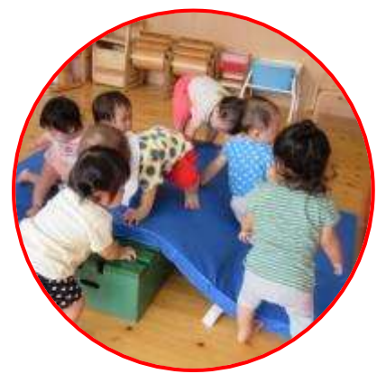
主体的な活動の場（生活の場）