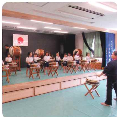
礼儀と集中力が備わる 和太鼓教室 4・5歳児

信和保育園では転んでも手がつけず前歯を痛める子どもが多かった時期がありました。遊び場を失った子どもたちには仕方のないことかも知れませんが、週一回の体育教室では基礎体力向上を図っています。