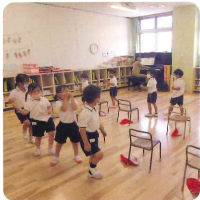
個性を育む 音楽教室 3・4・5歳児

4.5歳児は和太鼓をします。礼儀正しく、気持ちをひとつに、力強く躍動します。園児たちは生まれて初めて知る、大きな達成感に包まれ、胸を張って小学校の門をくぐっていきます。